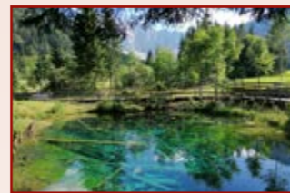
Bodental: Meerauge u. Vertatscha