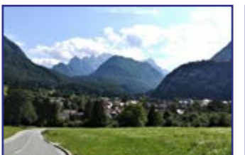
Mojstrana s skupino Triglava