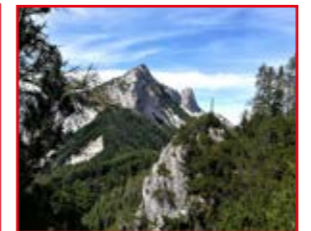
Dicke Koschuta und Koschutnikurm