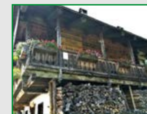
Rif. Eimblat de Ribn in Sauris di sotto