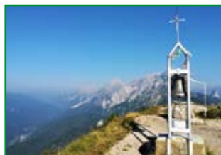
il Monte Talm