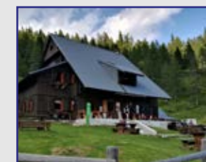
Koča na Loki pod Raduho