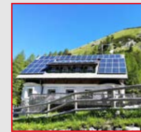
Klagenfurter Hütte mit Kosiak