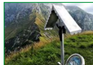
il Monte Guarda