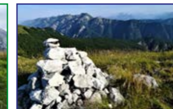
dalla Punta di Montemaggiore verso il Monte Zaiavor