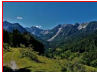
Bärental mit Kosiak und Hochstuhl