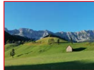
östliche Karawanken – Koschuta-Bergmassiv