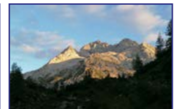
Triglav z Velega polja