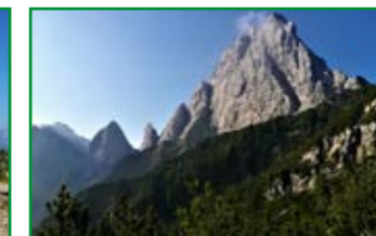
il Monte Sernio con la Torre Nuviernulis