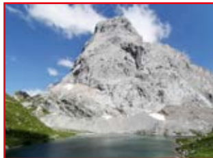
Wolayersee mit Seewarte