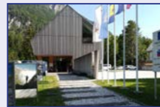
Slovenski planinski muzej v Mojstrani